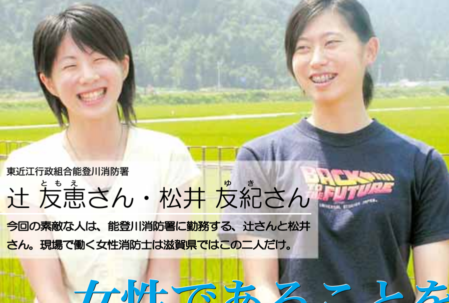
東近江行政組合能登川消防署