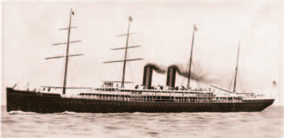
100年前ヴォーリスが乗ってきたチャイナ号(帆船に蒸気機関をプラスしたこの時期独特の汽船)

今からちょうど100年前の2月2日、24歳の米国人青年・W.M.ヴォーリスが近江八幡にやってきた。彼は83歳の生涯を閉じるまで日本で活躍し、伝道師、建築家、実業家、社会事業家として数々の業績を残した(4面参照)。