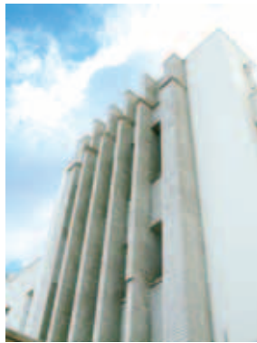
現在の八幡商業高等学校

ところが、「商売人には学問は必要ない」という当時の人々の考え方から、わずか10年で廃校の危機に直面した。これを知った八幡、蒲生、神崎地区の有力な近江商人たちが誘致運動に立ち上がり、多額の資金提供のもとに明治34年、近江八幡に校舎を建設し、学校を移したのである。それはヴォーリス着任の4年前のことであった。