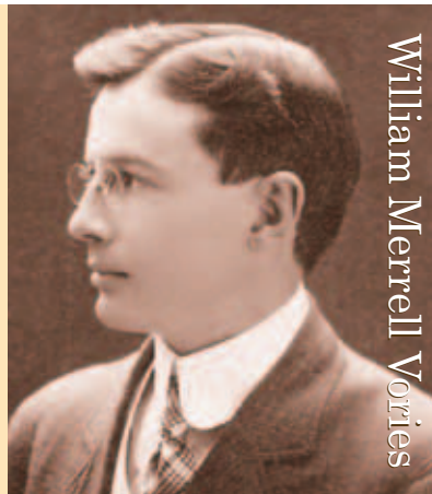
William Merrell Vorles