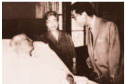
病床にあるヴォーリスを見舞われる三笠宮殿下(昭和36年/1961)