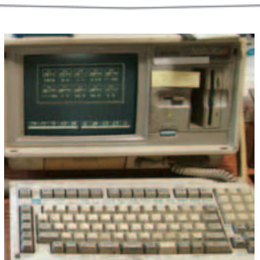
使い込まれたワープロは、長年の研究を共にしてきた相棒のようなもの