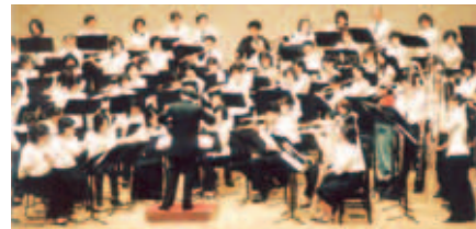
フルートフェスティバル in 滋賀

演奏に使われるフルートは7種類。普通のフルートの他、高音部にはピッコロ、ソプラノフルート、中音部にアルトフルート、低音部にバスフルートとコントラバスフルート(2種)と、大きさも形も違うフルートが使われ、その音域は6オクターブ以上に広がる。現在「湖笛の会」のメンバーは27名。国内はもちろん、海外公演もこなすなど意欲的に活動をしている。また、演奏会の他にもメンバーがサポートして「フルートフェスティバル in 滋賀」を毎年開催。このフェスティバルでは、初心者からベテランまでフルート愛好者なら誰でもオーケストラに出演できる。日頃は一人で静かに演奏するという人も、大勢で演奏する喜びを知る機会となり、愛好者にも評判だ。