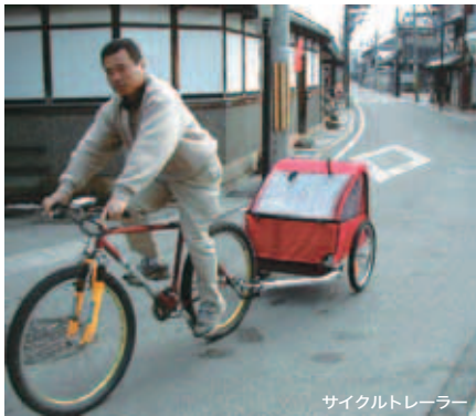
サイクルトレーラー