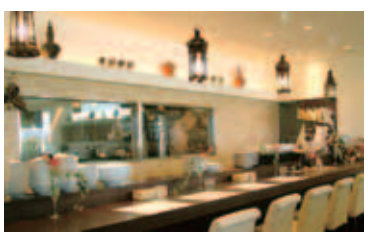
地中海風創作料理レストラン