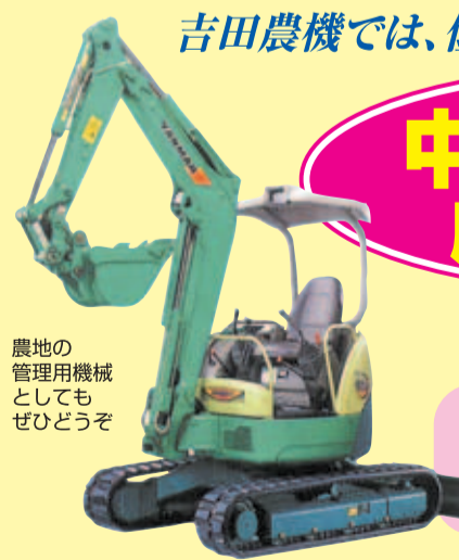
農地の管理用機械としてもぜひどうぞ