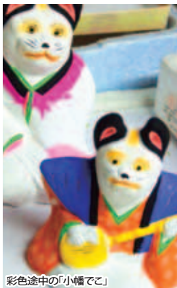
彩色途中の「小幡でこ」

五個荘小幡町に伝わる郷土人形「小幡でこ」。カラフルな色使いと土人形ならではの素朴なぬくもりが特徴で、かわいらしい姿は人形愛好家に親しまれている。節句人形や縁起ものを中心にその種類は約400にものぼり、中には千支の動