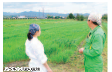
スペルト小麦の麦畑