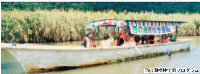
西の湖探検学習プログラム

陸や船上からだけでなく、パラグライダーに乗って航空撮影にもチャレンジし、西の湖の