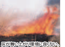
灰が舞い上がり環境に良くない。