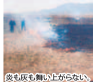
炎も灰も舞い上がらない。