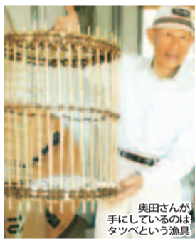
奥田さんが手にしているのはタツベという漁具

(「湖国まるごとエコ・ミュージアム」とは、滋賀県が推進する人と自然のつながりを大切にしようという運動)