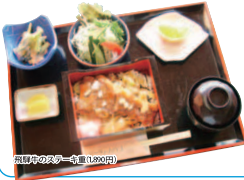
飛騨牛のステーキ重(1,890円)