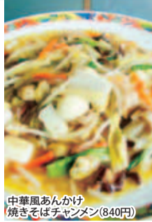
中華風あんかけ焼きそばチャンメン(840円)

ハウスを訪ねた。メニューは子どもから年配の方まで、幅広く楽しんでもらうためにと300種類近くある。「中華風あんかけ焼きそばチャンメン」(840円)や「飛騨牛のステーキ重」(1,890円)などオススメメニューが盛りだくさん。また地元米原で収穫された白大豆と北海道産の黒豆を使った自家製の豆腐