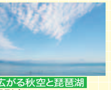
広がる秋空と琵琶湖