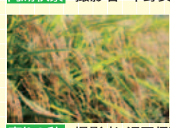
実りの秋

投稿作品はこちら www.gaido.jp/1996 プレゼントの当選(3人)は発送をもって代えさせていただきます。