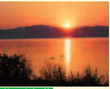
びわこも紅葉