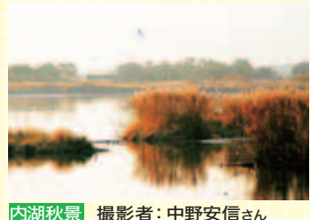
内湖秋景