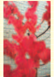
萌えるハート