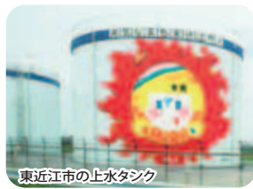
東近江市の上水タンク