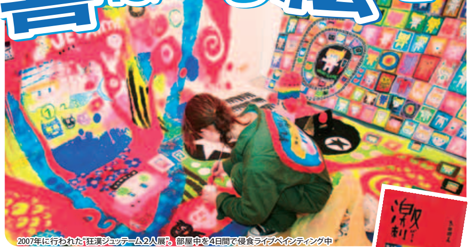
2007年に行われた「狂漢ジョッテーム2人展」部屋中を4日間で侵食ライブペインティング中

お金に余裕のない厳しい毎日。それでも苦しい出来事さえ「話のネタになる!」と明るく受け止められたという。その後、人との出会いによって作品発表の機会が増え、03(平成15)年にニューヨークで、05(平成17)年にパリで作品を展示したほか、04(平成16)年にはアートブック「激刺」(青心社)を出版した。