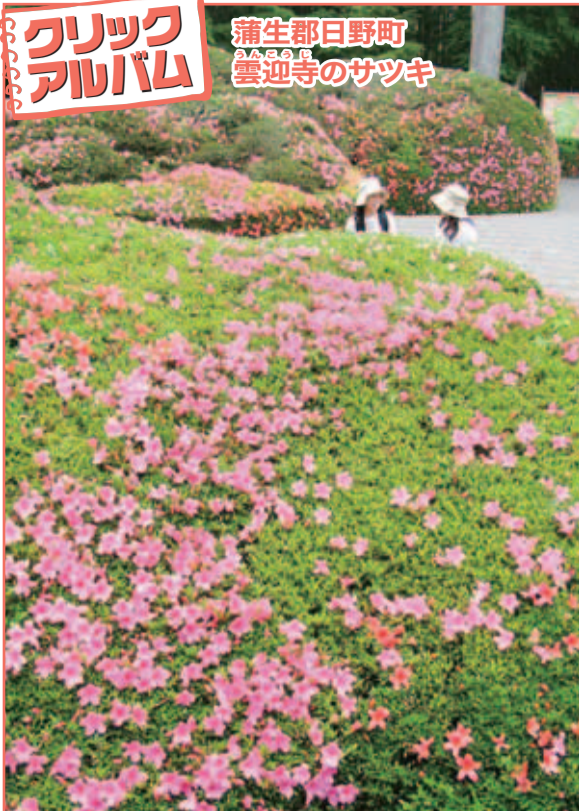
蒲生郡日野町 雲迎寺のサツキ

雲迎寺は別名「さつき寺」として有名だ。境内と参道には約1000株のサツキの古木があり、例年6月の上旬から中旬にかけて華やかな紅色に染まる。中でも樹齢約400年のサツキの木は見上げるほどの高さがあり見応え十分。近くには蒲生氏ゆかりの音羽城跡が公園として整備されており、ゆったりと散策しながら歴史に触れるのもよさそうだ。