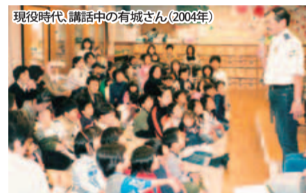
ボランティア110番動物園 ●東近江市山上町2780 ●TEL:090-3623-5346