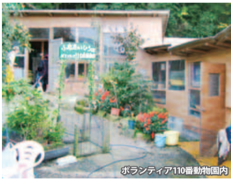
ボランティア110番動物園内