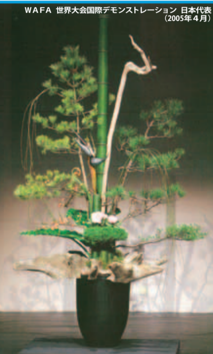
WAF A 世界大会国際デモンストレーション 日本代表 (2005年4月)