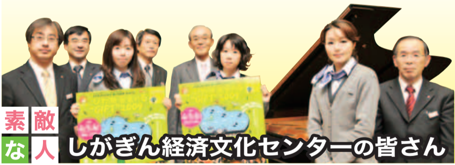
素敵な人 ししがぎん経済文化センターの皆さん