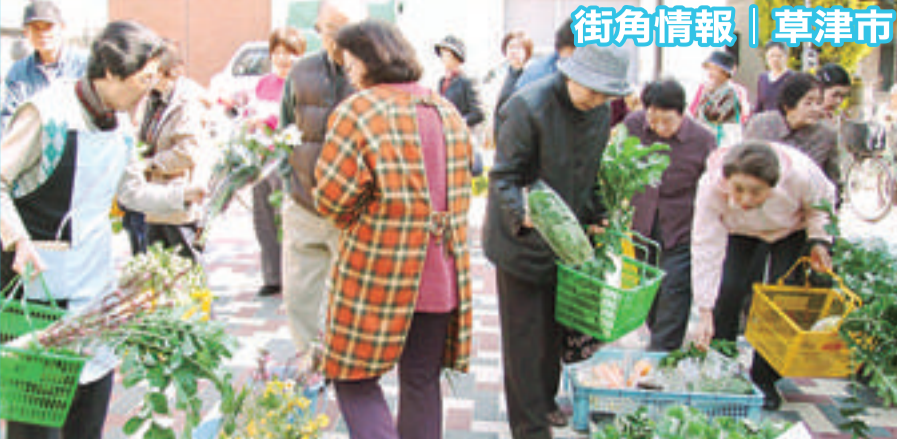
街角情報 | 草津市

滋賀会館シネマホール TEL:077-522-6232 大津市京町3-4-22(滋賀県庁正門前)