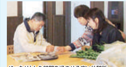
ゆったりとした時間を過ごせる広い休憩所