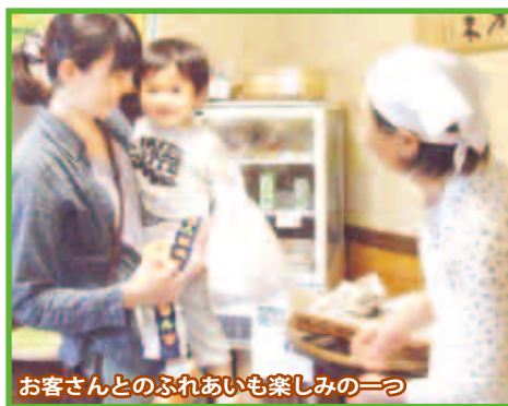
お客さんとのふれあいが楽しみの一つ

「授乳中に出合って以来、このパンばかり食べています。子どもにも安心して与えられます」「かみしめるほどに味わい深く、飽きのこない味です」など、お客さんの喜びの声がパン作りの原動力になっている。