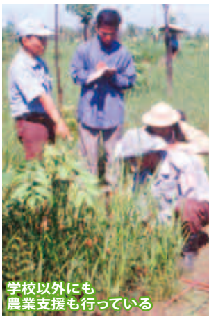
学校以外にも農業支援も行っている

活動に必要な資金は通訳の仕事や日本での講演などで賄う。日本へ戻ったときは大学の客員教授で稼いで仕送りする。「自分のためにお金を使うと損をした気分になる」。100円あれば1人の生徒が学校へ通えると思うと、