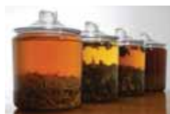
葉や根、実などを漬けて熟成させた、栄養豊富な植物エキス。