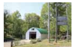
北海道の自社農園で育った力強い植物がオラクルの原点です。

60種類の植物成分が肌に働きかけ、肌本来のキメやハリをもたらすスキンケア「オラクル」。植物が部位ごとに持つパワーに着目し、独自の処方では抽出した植物の濃密エキスを贅沢に配合。エキスが角質層にしっかり浸透し、豊かな弾力と、みずみずしいハリを。根本から健康で美しい肌へと導きます。