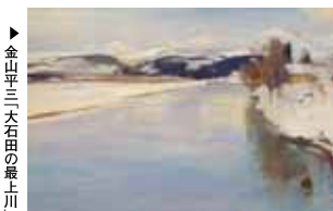
▶ 金平三三 大石の最上川