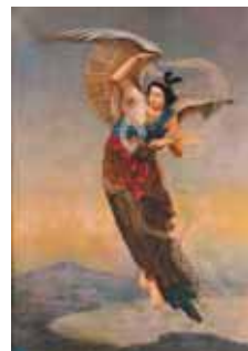
▶ 本多錦吉 歌羽衣天女