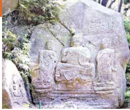
石坂磨崖仏 博物館にはレプリカが展示されている

栗東歴史民俗博物館で特別展示「石にみるくらしといのり」が行われている。2月19日(日)まで。栗東市内には、「上砥山」という地名があることから、砥石が採れたようである。一方、奈良時代の石造文化財「石坂磨崖仏」があって