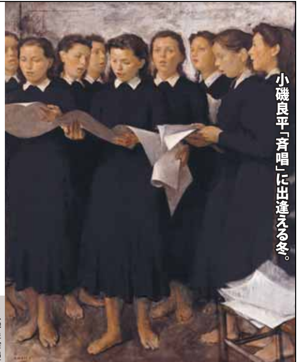
小磯良平「斉唱」に出逢える冬。

THE MUSEUM OF MODERN ART, SHIGA 滋賀県立近代美術館