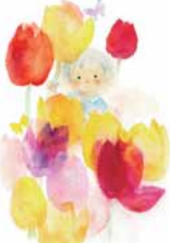
「チューリップと子ども」(1970年ごろ)

前売り料金 一般800(1000)円、大学生600(800)円、高校生・65歳以上400(500)円。中学生以下無料＝カッコ内は当日料金