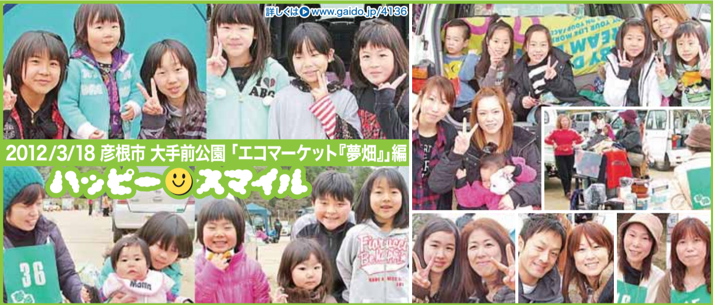
2012/3/18 彦根市 大手前公園「エコマーケット『夢畑』編

滋賀営業所 TEL(077)521-8848(代) FAX(077)526-1504 京都営業所 TEL(075)241-2429(代) FAX(075)241-2147 本社 TEL(06)6346-2800(代) FAX(06)6346-8848 URL: http://www.kousoku-offset.co.jp/