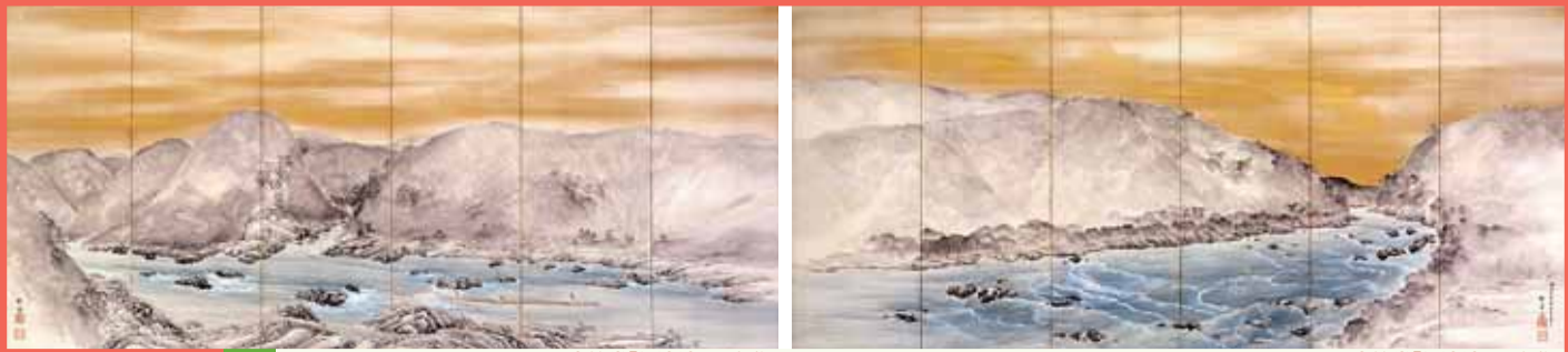
岸竹堂「保津峡図」(左隻)