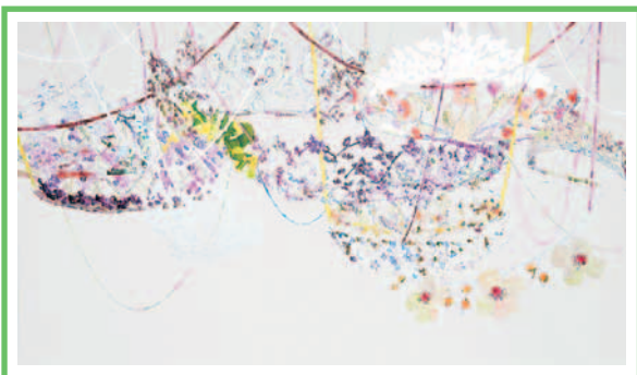
「嘘ついてさよなら」2012年 綿布に油彩、アルミ箔、ジェッソ 195×340cm ©FUJII Toshiharu

「自分が見ている世界は他人に同じように見えているとは限りません。人によって見え方が異なります。逆に、物には『誰によってどのように見られるか』でさまざま