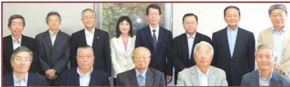
【湖国協会役員メンバー】