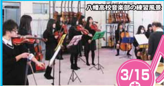
八幡高校音楽部の練習風景