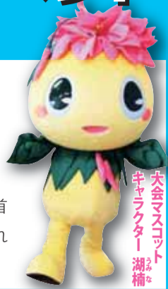
大会マスコット キャラクター「湖びわこ」

本番の「びわこ総文」が行なわれるのは来年7月28日(火)~8月1日(土)。全国各地や海外から約2万人の高校生が集まり、観客数は10万人が見込まれている。(取材・録山)