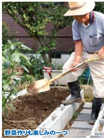
野菜作りも楽しみの一つ

ち合う球技)で汗を流し、ゴルフの練習も欠かさない。さらに60歳からは俳句を始めた。山登りから受けた感動など写真では表現できないことを記録したいと思ったからだ。現在、「芦の芽句会」という俳句の会に所属。常に手帳を持ち歩き、四季の感動を書きとめている。