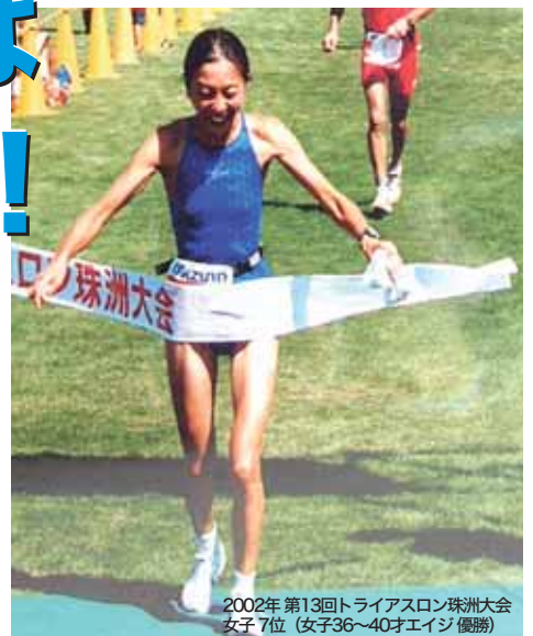
2002年 第13回トリアスロン珠洲大会 女子7位(女子36~40才エイジ優勝)