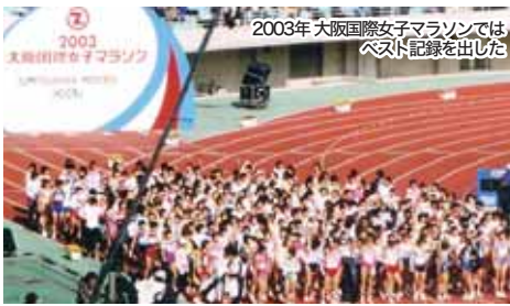
2003年 大阪国際女子マラソンでは ベスト記録を出した