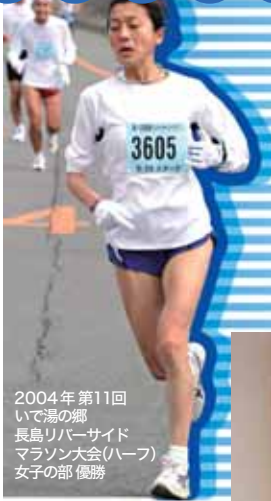
2004年第11回 いで湯の郷 長島リバーサイド マラソン大会(ハーブ) 女子の部 優勝