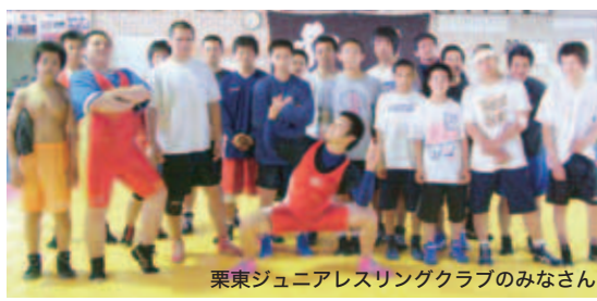
栗東ジュニアレスリングクラブのみなさん