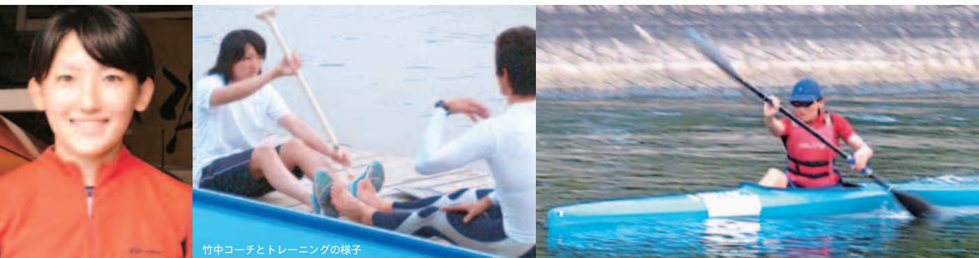
竹中コーチとトレーニングの様子