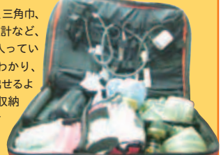
パラメディック バッグ

血圧計、包帯、三角巾、聴診器、体温計など、どこに何が入っているか一目でわかり、さっと取り出せるよう機能的に収納されています