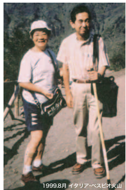
1999.8月 イタリア・ベスピオ火山

世界を旅する目片さんも、大好きなテニスやチェロが楽しめなくなったことは残念でならない。コンサートでチェロの音色を聞いて流す涙は感動半分、弾けない悲しさ半分。「いつか感動の涙だけになる日が来ることを信じています」と話す。ありのままの自分を受け入れ、前向きに生きる姿が印象的だった。(取材・大西)