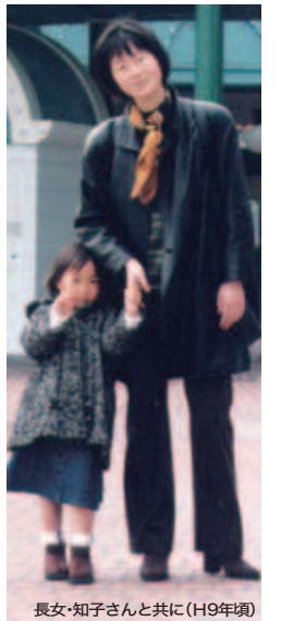
長女・知子さんと共に(H9年頃)

女性の社会進出についてさらに尋ねてみたところ、「特に私自身の体験から、中小企業で女性が働きながら子どもを育てることの大変さを痛感しました。直前も、管理職に就かせて頂いていましたが、家族・友人らの支えがあればこそ。社会が子供を育てていく仕組みをつくってほしい」と、熱い決意を語ってくれた。(取材・竹末)