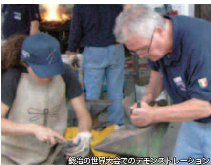
鍛冶の世界大会でのデモンストレーション

鍛冶は日本刀などの「美術工芸品」、料理人の包丁といった「職人の道具」、フェンス・