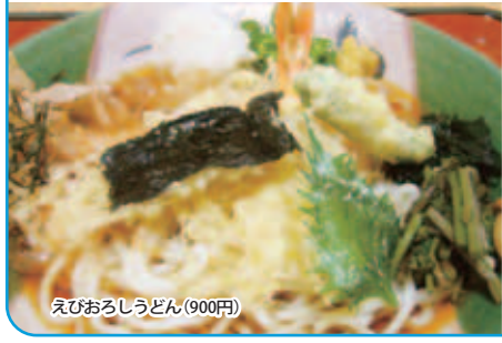
えびおろしうどん(900円)

今回は石部販売所の紹介で「めん処 まさ八」を訪ねた。ここでは「韃靼そば」をブレンドした独自のそばが味わえる。