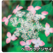
ベニガクアジサイ