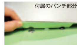
付属のパンチ部分

文具について話し合う中で出てきた要望を文具メーカーに持ち込み、一緒に商品化することもある。文具はオフィス向けに作られているものが多く、学