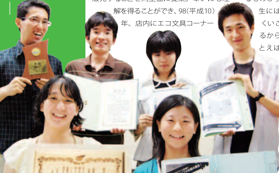
素敵な人 滋賀県立大学(彦根市)グリーンコンシューマサークルの皆さん