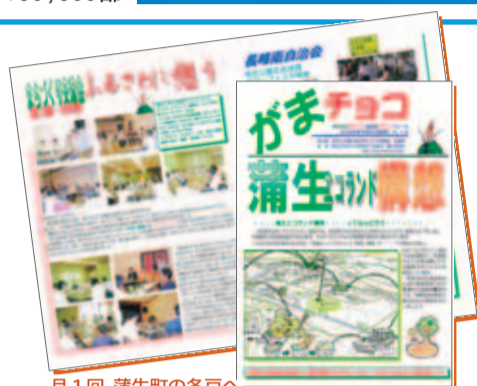
月1回、蒲生町の各戸へ配布される広報誌「がまチョコ」

るような、地域に根付いたまちづくりが大切。自分たちでできることは自分たちでやりたい」と熱く語る。目指すところは、皆が住み続けたいと思えるまちづくりだとキッパリ。