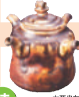
大西忠左「信楽自然ヒートロウ 四ツ口茶注」