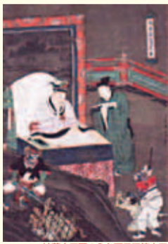
地藏十王図のうち百日平等大王

開催中 栗東 特集展示 阿弥陀・地藏・十王 阿弥陀如来やその西方極楽浄土、生前の行いを裁いて生まれ変わる先を決めるとされた十王など、死んだらどうなるのか、また現世での行いはどのように総括されるのかを描き出す作品を紹介。 ●場所:栗東歴史民俗博物館(栗東市小野223-8) ●時間:9:30~17:00(入館16:30まで) ●休館日:7/13 ※14日は展示室のみ休業 ●料金:無料 ●問い合わせ:栗東歴史民俗博物館/077-554-2733