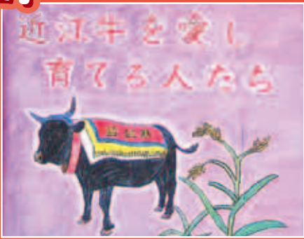
近江牛を愛し 育てる人たら

竜王西小学校の読書ボランティアとして活動する、竜王西小学校絵本を読む会「ぼえむ」の皆さん。その活動は子どもたちに読書の良さを伝えるだけにとどまらず、地域に伝わる民話や伝説を大型紙芝居にして読み聞かせるという、まさに現代の語り部としての役目を担っている。