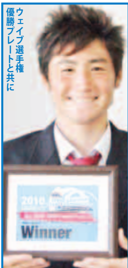
優勝プレートと共に ウェイブ選手権

ウインドサーフィンはボードに取り付けた帆を操作して水面を滑走するスポーツ。板庇君が競技するのは、波乗りとジャンプの美しさを競う種目「ウェイブ」。