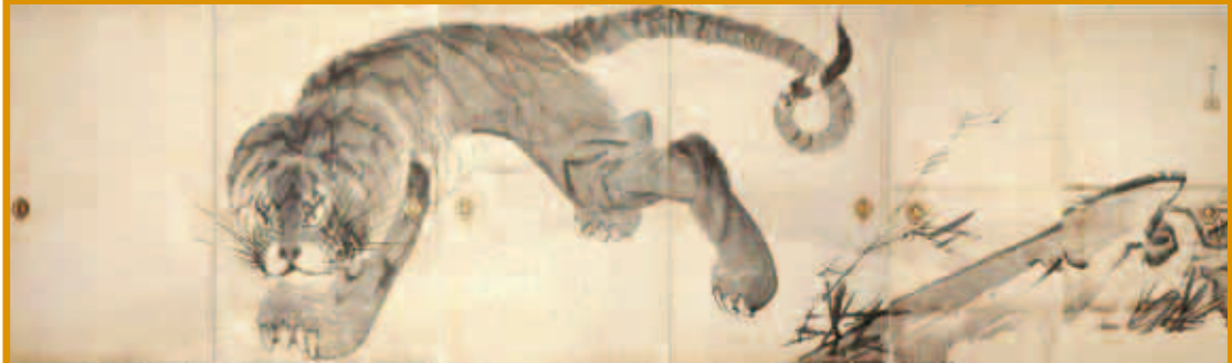
虎図模【重要文化財】(展示4/19～5/8)

3月12日から甲賀市のMIHO MUSEUMで春季特別展「長沢芦雪 奇は新なり」が開催される(6月5日まで)。 長沢芦雪(1754-1799)は円山応挙に学び、大胆な構図や生き生きとした動物の動きを表現した作品などが有名で、天才画家と言われて