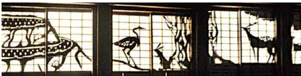
「伊吹の天窓」の展示

米原市が「みらい・つくり隊」として、地域の活性化に取り組む人材を募集していることを知り、今年4月、大阪から移住した。築100年以上の家を改修しながら住む。住民と一緒に地域作りの活動やイベントに参加、草刈りや掃除を行う。